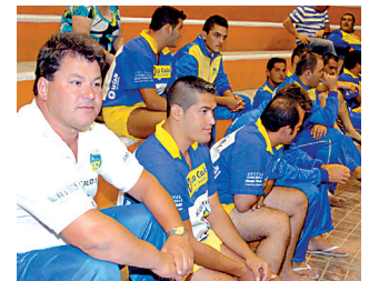
El Maninidra esperando. | MARRERO

Tras inscribir en el acta federativo lo ocurrido por par-