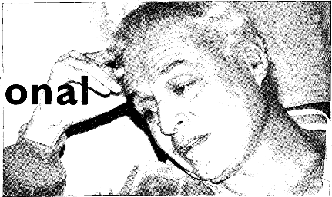
«Los tinerfeños son manipulados por la burguesía urbana de Santa Cruz»

—Cuando en la isla de Tenerife se comprenda que vienen siendo manipulados por una burguesía urbana, radicada exclusivamente en Santa Cruz y que a través de los «mas media», está ejerciendo un dominio pernicioso sobre la opinión pública y la conciencia de dicha isla.