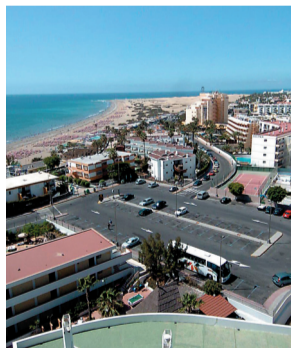
Playa del Inglés.

Buena noticia. Más que gastar dinero en publicidad, al turista se le engancha ofreciéndole un servicio y un producto de calidad. ¿Cómo íbamos a pretender que vengan los turistas con la Playa del Inglés y su entorno tan deteriorado, y con "profesionales" que tratan al trancazo a los turistas? | Gustavo