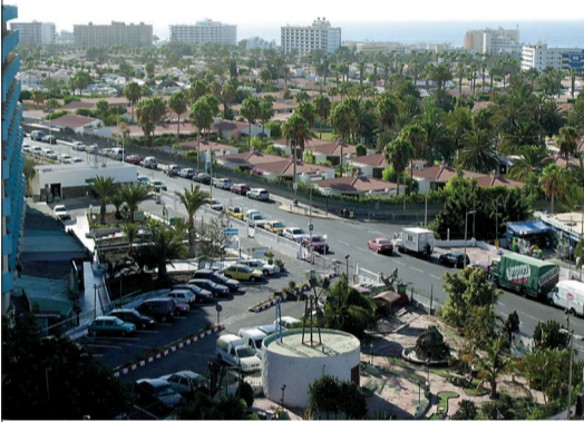
Vista de Playa del Inglés.

¿Y cuándo van a comenzar los trabajos, cuan-