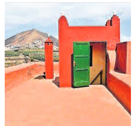
Interior del salón de estar y la azotea-mirador con sus escaleras en Villa Melpómene, muestra de la arquitectura original del siglo XIX cuando alojó al compositor francés Camille Saint-Saëns.